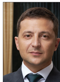
Президент України Володимир Олександрович Зеленський 2019–